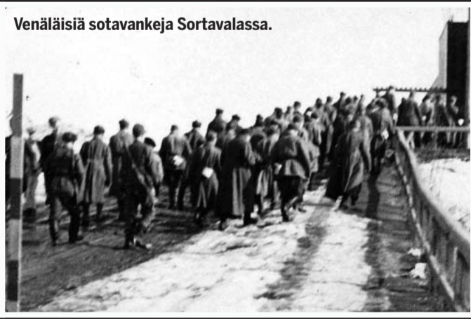
Venäläisiä sotavankeja Sortavalassa.