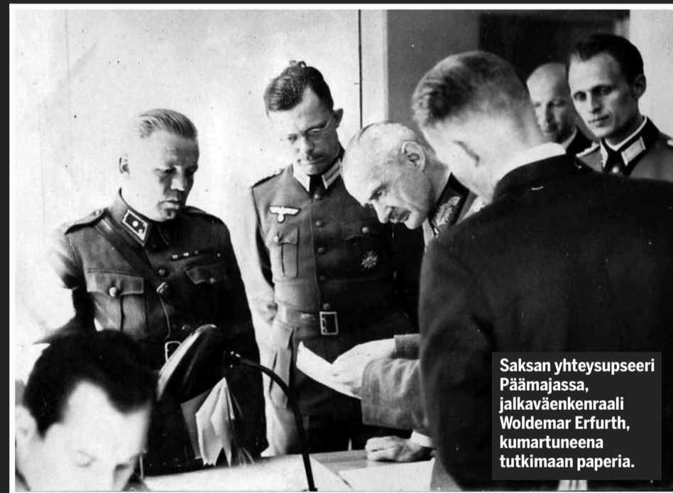
Saksan yhteysupseeri Päämajassa, jalkaväenkenraali Woldemar Erfurth, kumartuneena tutkimaan paperia.