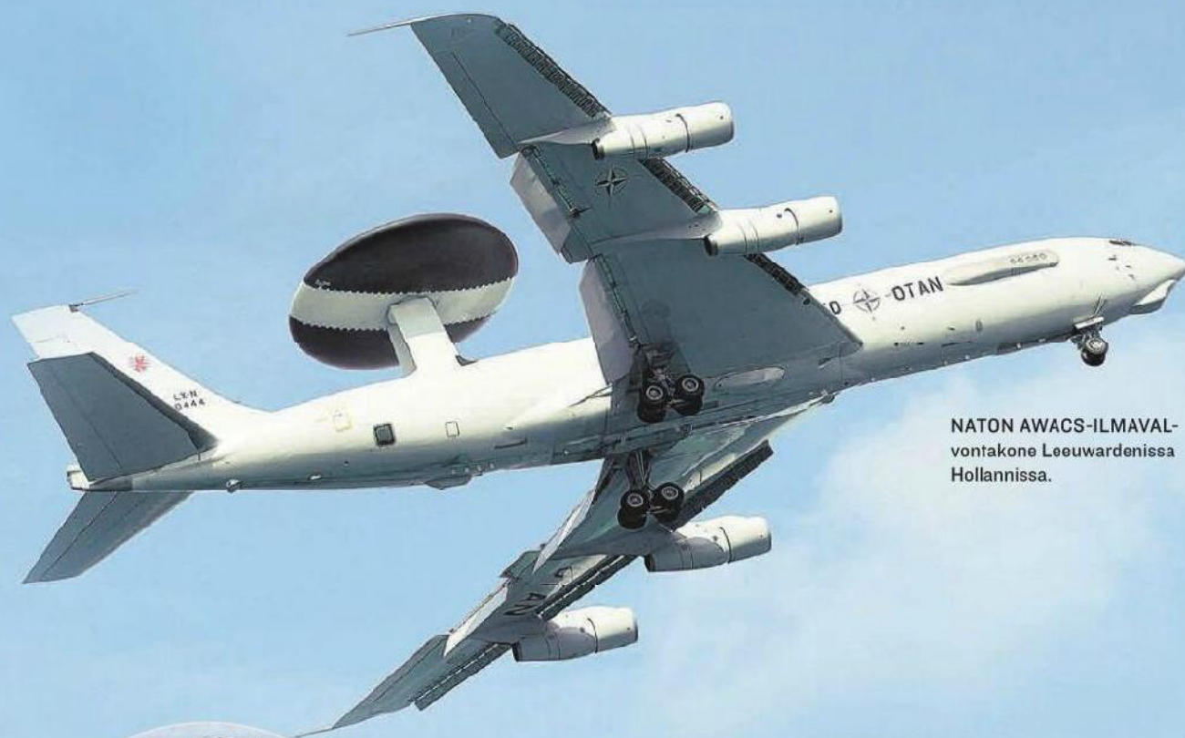
NATON AWACS-ILMAVALVONTAKONE Leeuwardenissa Hollannissa.